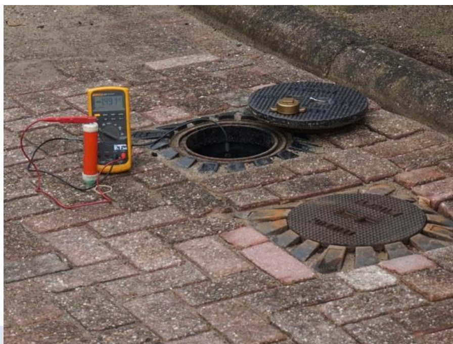
Voorbeeld van een Kb-meting.

De inspecteur plaatst bij het vaststellen van de MEP-in en de MEP-uit de \text{CuCuSO}_4 -referentiecel altijd zo dicht mogelijk boven de tank, in een vochtige bodem die aan het maaiveld visueel niet is verontreinigd met bijvoorbeeld morsproduct.